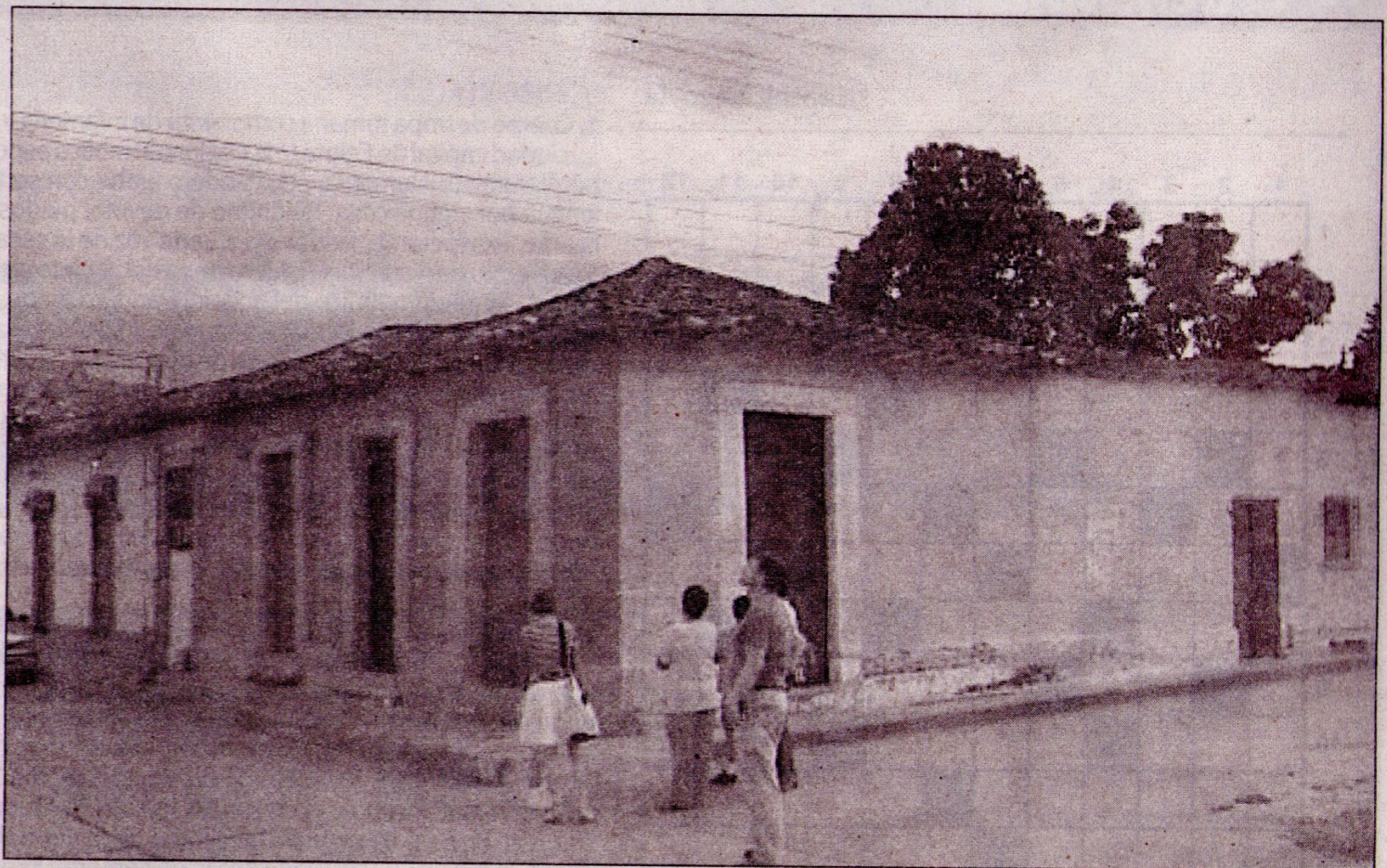
La casa natal de Gerbasi en Canoabo, estado Carabobo.